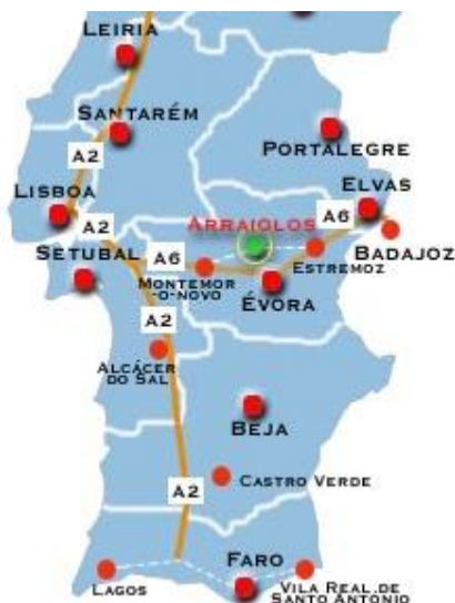
Fig 1: Localização de Arraiolos no território nacional.

❖ Arraiolos é uma vila alentejana situada no distrito de Évora e cobre uma área territorial de 684,08Km 2 . Tem uma população de 7.363 habitantes (Censos 2011), é sede de Concelho e agrega cinco freguesias: Arraiolos, Igrejainha, Vimieiro, União das Freguesias de S. Gregório e Santa Justa e União das Freguesias da Gafanhoeira(São Pedro) e Sabugueiro. Dista 136 km de Lisboa, 95Km de Espanha e 22 km de Évora.