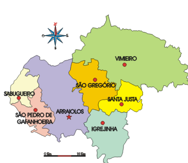
Fig.2: Mapa do Concelho com Freguesias.